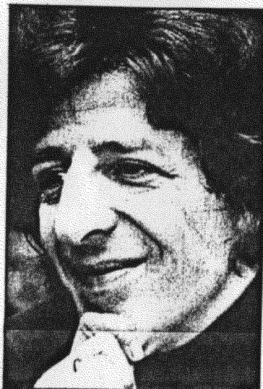
3 - Io cerco il contatto con il pubblico. Quello che voglio è raccontare l'attualità.