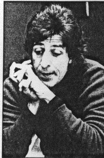
4 - I miei modelli in senso molto lato e tenute le debite distanze sono Fo e Petrolini.