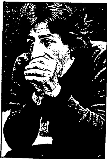
5 - Tra me e Fo non si può fare un confronto. Fo è un maestro, un genio del teatro.