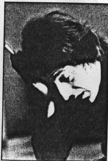
6 - Non guardo al futuro, mi basta vivere oggi. Intendiamoci: vivere, non sopravvivere.