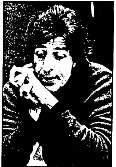
4 - I miei modelli in senso molto lato e tenute le debite distanze sono Fo e Petrolini.