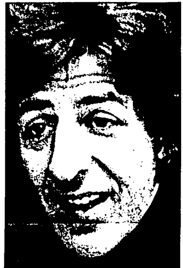
1 - Quando presi la maturità e mi iscrissi alla Bocconi pensavo solo alla chitarra.