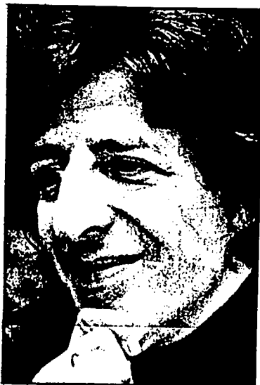
3 - Io cerco il contatto con il pubblico. Quello che voglio è raccontare l'attualità.