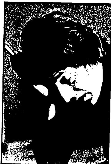
6 - Non guardo al futuro, mi basta vivere oggi. Intendiamoci: vivere, non sopravvivere.