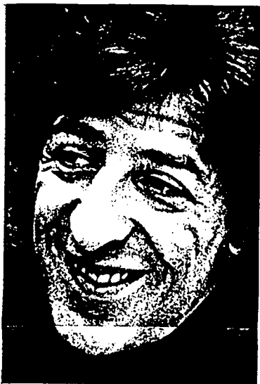
2 - L'università l'ho subito abbandonata. Ho fatto i primi passi insieme con Celentano.

«Non credo che una canzonetta possa cambiare il mondo. Neanche un intero festival. Canto storie nelle quali il pubblico si può riconoscere. I miei modelli? Dario Fo e Petrolini»